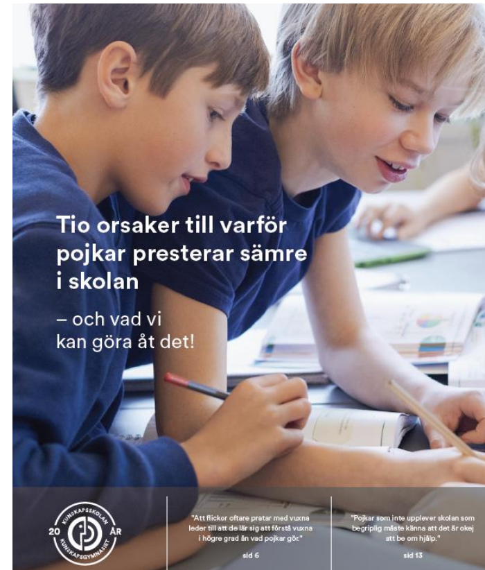
Tio orsaker till varför pojkar presterar sämre i skolan. Till boken