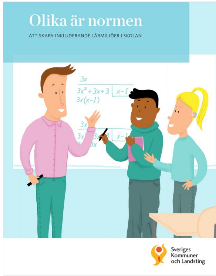
Olika är normen Att skapa inkluderande lärmiljöer i skolan Till boken