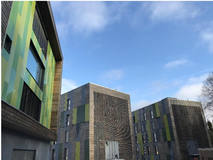
Remmen studentboliger, Halden