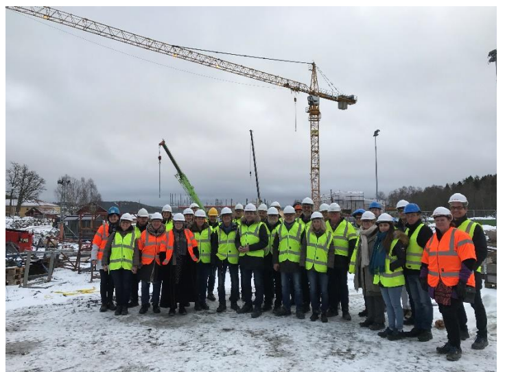
Lislebyhallen, Fredrikstad Risum skole, Halden