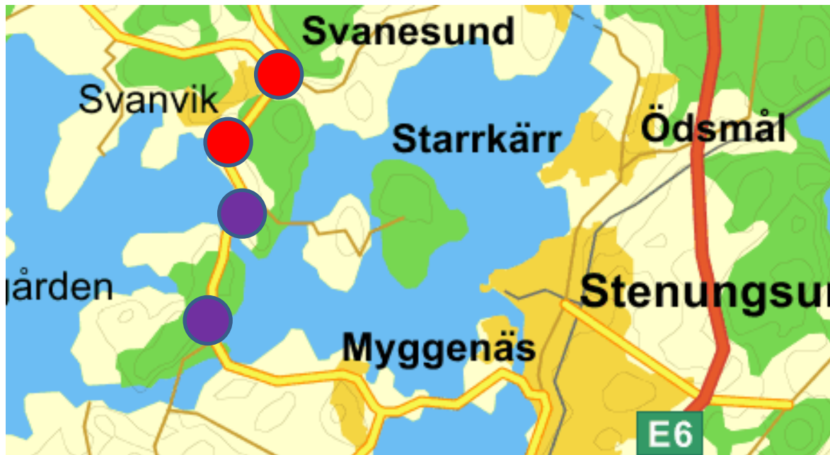
Bild: De lila hållplatserna Skåpesund norra och Säckebäck är föreslagna omlotthållplatser. DKR Fyrbodals menar att hållplatserna Varekilnäs och Varekil busstation (röda) bör läggas till som omlotthållplatser. Genom att dessa hållplatser får dubbel zontillhörighet, så förbättras förutsättningarna för kollektivtrafikpendling söderut till och från Orust.

Västsvenska Paketets ledningsgrupp (Trafikverket, Göteborgs stad, Västtrafik, Västra Götalandsregionen, Region Halland och GR) har tagit beslut om att Orust kommun får 2 mkr för att för att bli bygga pendelparkering med 75 bilplatser och 32 cykelplatser i Varekil. Markförhandlingar är klara och det finns ett kommunstyrelsebeslut för markköp. Ett beslut om att lägga Varekil busstation i zon B i zonstrukturen harmonierar med intentionerna att göra Varekil till ett pendlingsnav. I Varekil möts busslinjerna på Orust samt väg 160, väg 174 och vägen mot Svanesund (färjan). I Varekil finns bland annat bensinstation, livsmedelsaffär samt annan handel på gångavstånd. Varekil är mer eller mindre ett lämpligt pendlingsnav.